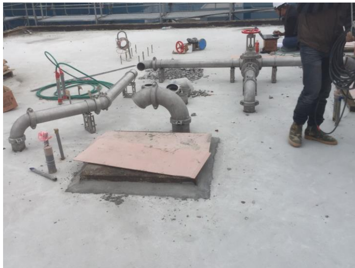
日期： 12/15 施作內容： B棟 R3F 管線配置