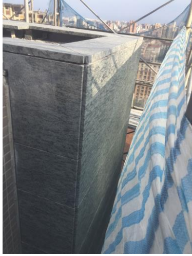
日期： 12/20 施作內容： A棟 RF 女兒牆&柱施作完成