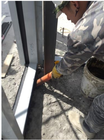
日期： 12/25 施作內容： RF 帷幕框 填縫施作