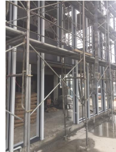
日期： 12/11 施作內容： A棟屋突格柵