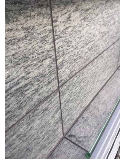
日期： 12/21 施作內容： 外牆石材填縫施作