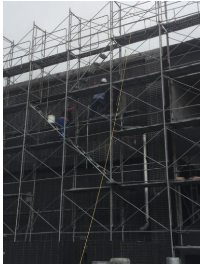
日期： 12/5 施作內容： A棟 R樓外牆磁磚清洗