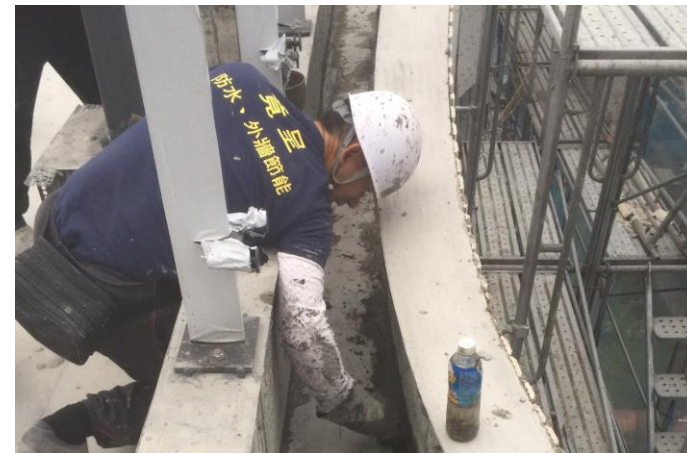
日期： 12/17 施作內容： AB棟女兒造型牆邊溝防水抓角