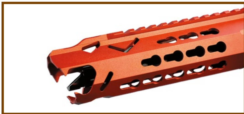
槍口抑制器採用鏤空的特殊豹頭造型，野性十足。