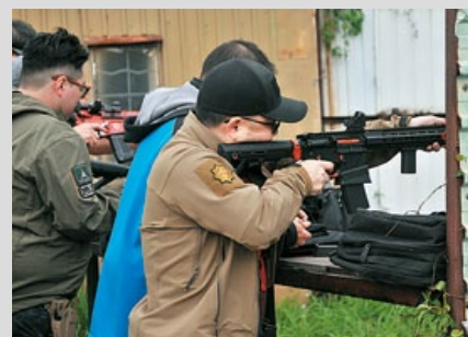
選手為自己的霰彈充氣和測試電池。