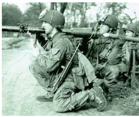
韓戰時正準備發射火箭筒的美軍傘兵，肩背的就是M1傘兵卡賓槍。