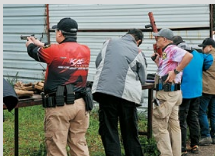
正在整裝待發的參賽選手。