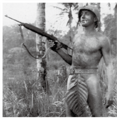
在南太平洋小島上手持M1傘兵卡賓槍的美軍士兵。