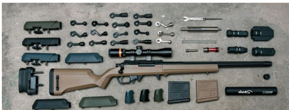
Amoeba推出的Striker改裝戰術配件一覽。

己的氣動狙擊槍，變形蟲(Amoeba)這次推出的戰術配件包括腮墊、可調式腮墊、可調式槍托墊片、槍托握把護片、槍機拉柄、防火帽、氣筒和彈簧等，大致上可分成槍托用配件、發射配件及槍口配件三大類，可以說整支AS-01打擊者(Striker)狙擊槍都能改裝！