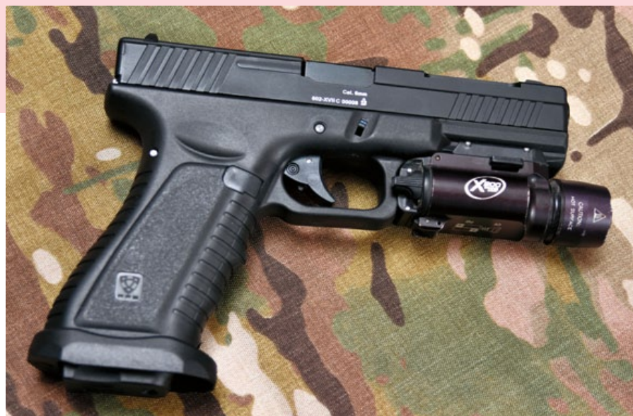
下槍身有戰術軌道，可安裝槍燈或雷指器。