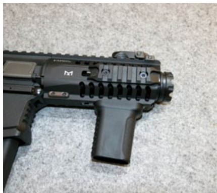
短槍管搭配小巧的戰術握把，堪稱短小精悍。