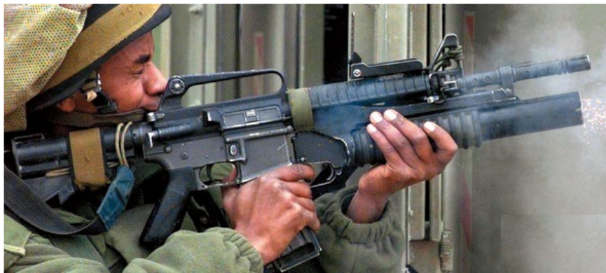
以色列士兵正使用裝在M653 Plus步槍上的M203發射榴彈。