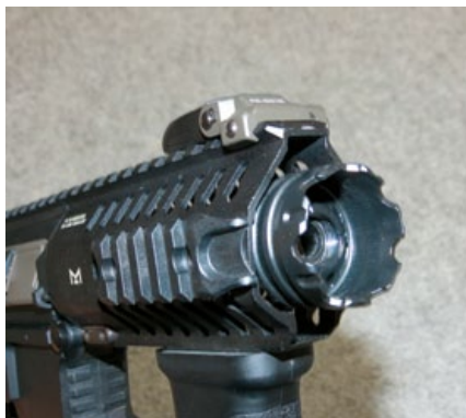
時下潮槍必備的攻擊型火帽。

目前市面上常見的眾多生存遊戲槍中，多以M4/AR或AK槍系為主流，原因在於這兩款實銃仍是目前世界多國部隊的制式配槍，經過長久的實戰歷練後，在操作性和功能性上均已符合現役士兵的需求，所以這兩款槍的擬真玩具槍版本也廣受生存遊戲玩家們的青睞，但是生存遊戲用槍畢竟和實銃的設計上有很大的不同，所以一把符合生存