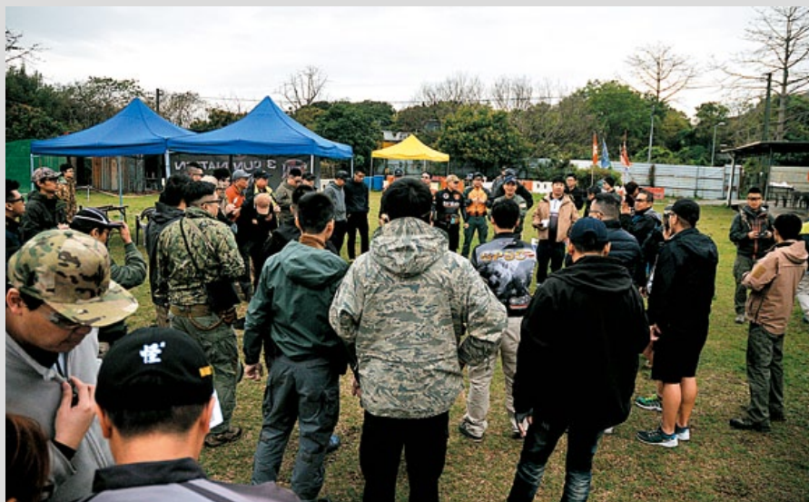
選手正在仔細聆聽總RO講解整個比賽流程。