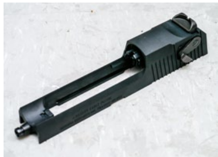
WE的工藝有目共睹，連滑套前方的導氣活塞也忠實複製。