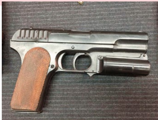
《金牌特務》片中出現的TT33，其實是不能發射的道具槍，因此也激發了SG研製可操作氣槍的念頭。