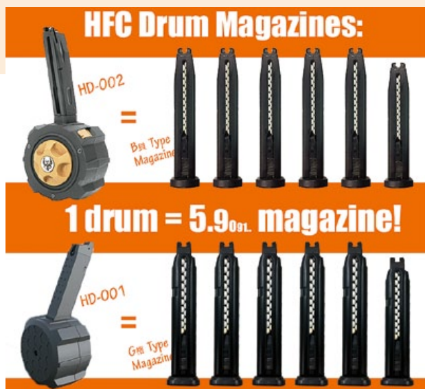
HFC彈鼓的英文廣告，一個彈鼓抵過5.9只普通彈匣的容量。