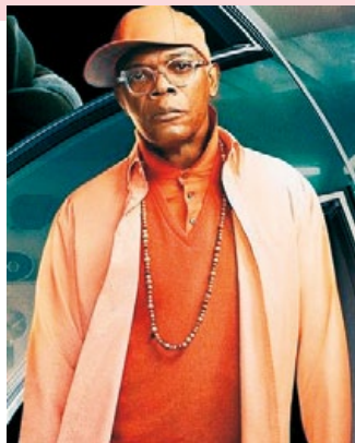
《金牌特務》片中大反派里奇蒙·范倫坦(Richmond Valentine)的夢想職業是當一個“紳士間諜”。

在賣座電影《金牌特務》(Kingsman: The Secret Service，港譯：皇家特工)片中，由山繆·傑克森(Samuel L. Jackson)所飾演的大反派里奇蒙·范倫坦(Richmond Valentine)曾說過：「當我還是一個小孩的時候，我的夢想職業是當一個“紳士間諜”」；誠如其所言，特務總是給人一種冷酷而又神祕的感覺，而在一堆以特務為題材的電影中，各種五花八門的特殊裝備彷彿有一種能夠深深吸引觀眾的魔力；今天我們要介紹的主角，正是來自《金牌特務》(Kingsman)片中的TT33特務手槍，在電影中這把配置下掛式霰彈發射