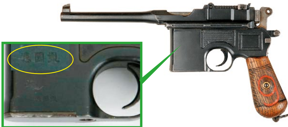
1930年代初輸入中國的C96實銃上，大多會刻上“德國製”的中文字樣。