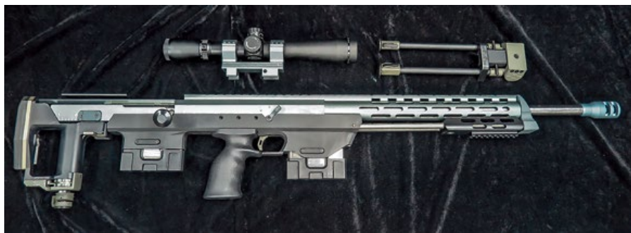
Ares DSR-1 除了折疊式腳架外，還附贈一只 3.5-10 x 50mm 狙擊鏡。