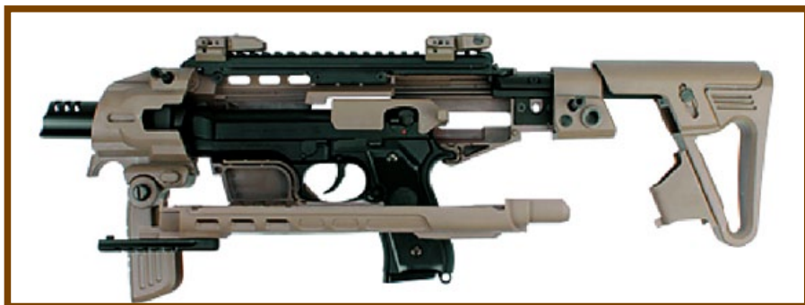
裝上 M92 手槍後的 KA RONI 改套，闔上側邊槍身即可使用。