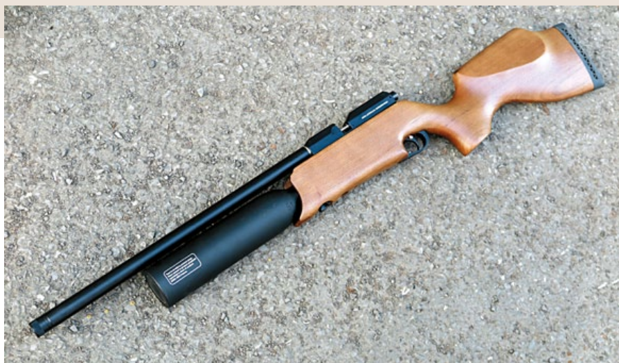
Artemis M16A 採用傳統獵槍槍托，射手較易適應。