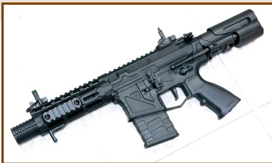
PER Mk VI 是幽靈終極系列中最緊緻的成員，全新設計的 CRS 伸縮托外觀質感極佳。