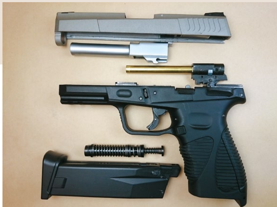
KWC PT24/7 的大部分解，其復進簧導桿為兩截式以減輕後坐力。