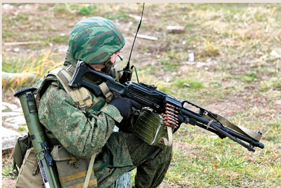
來自第四近衛裝甲師的俄軍手持 PKP 機槍和 RPG-26 反坦克火箭。(By Wikipedia)