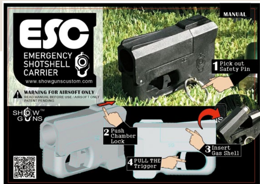
SG最新推出的「隱藏式絕地武器」廣告海報。