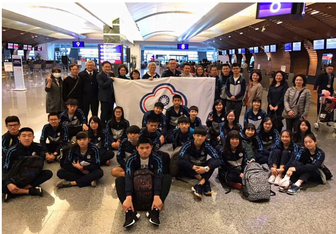
( 團 體 合 照 )