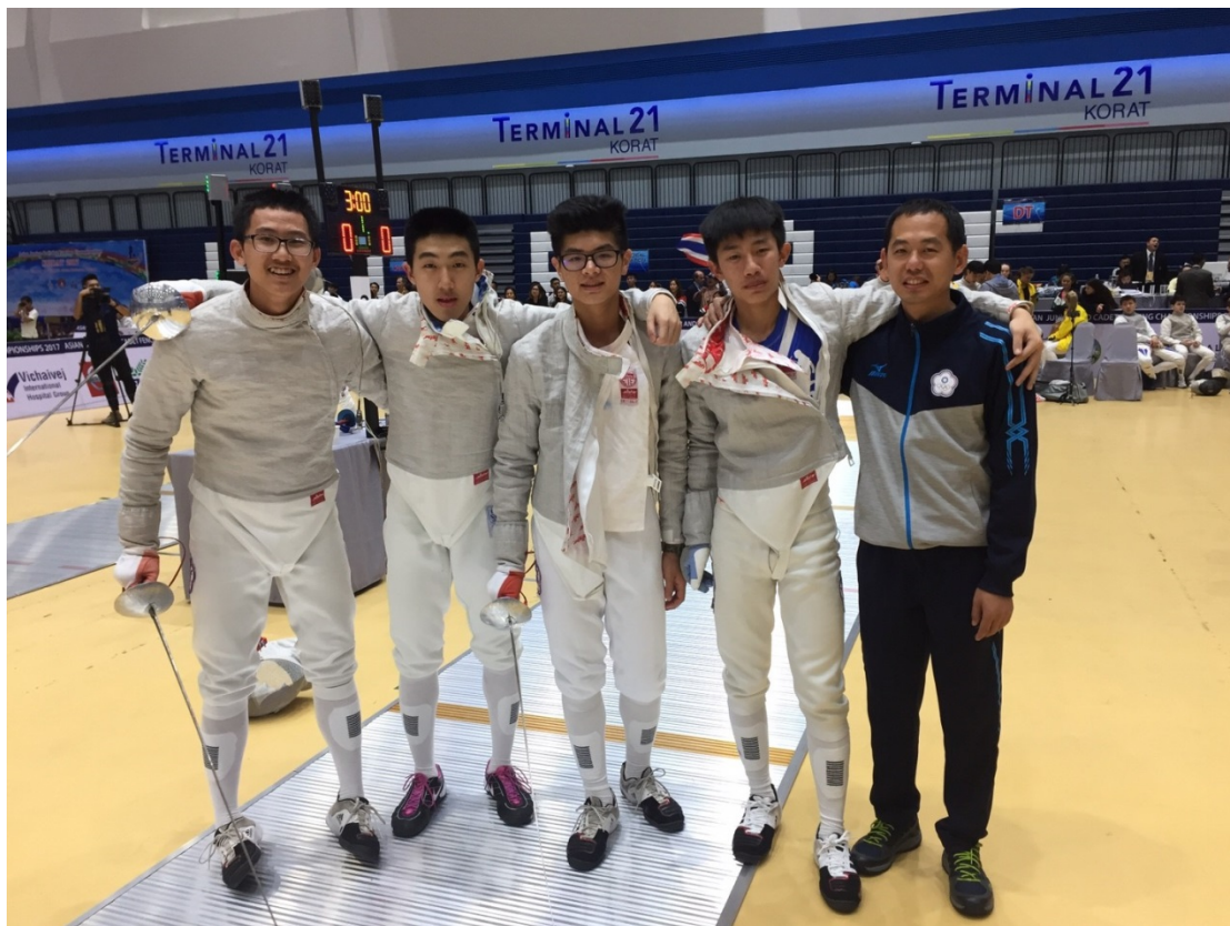
(青少年軍刀隊賽後合照)