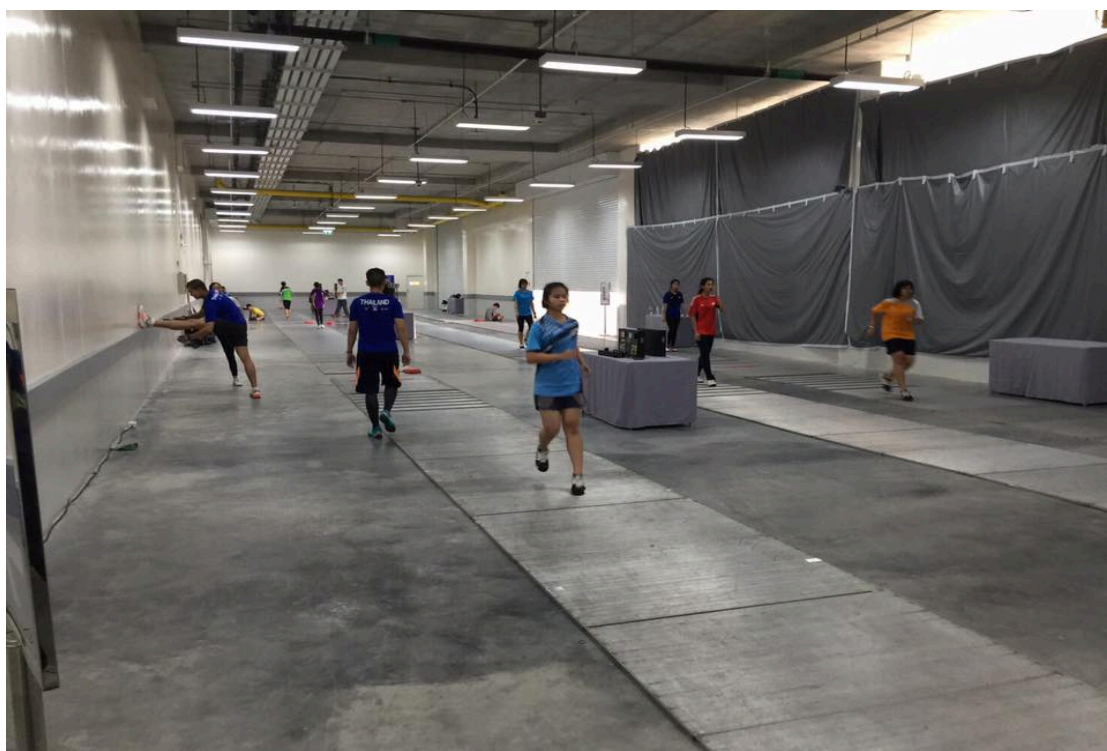
( 訓 練 場 地 )